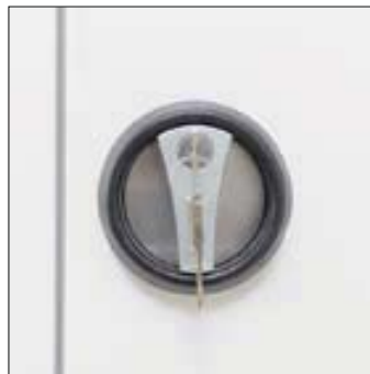
Versperrbarer Drehgriff mit 2 Eigenschlüsseln