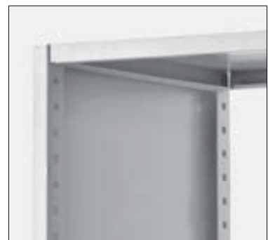
Geschlossener Stahlrahmen ungelocht