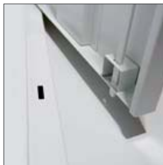
Triebstangenführung für zusätzlichen Einbruchschutz