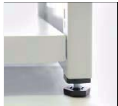
Höhenverstellbar mittels Verstellgleiter für das Ausgleichen von Bodenunebenheiten