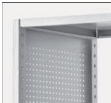
Geschlossener Stahlrahmen gelocht Ø 6 mm