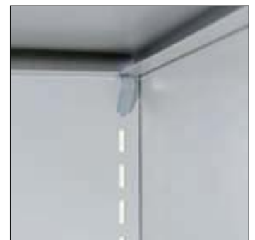
Fachbodeneinhängewinkel im 30 mm Raster