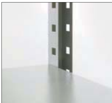
Offener Stahlsteher – Profil

Durch das einfache, werkzeuglose Einhängen der Fachbodenträger ist das Umrüsten oder Erweitern der Regale jederzeit möglich. Durch die Konstruktion ist der Fachboden gegen Verrutschen gesichert.