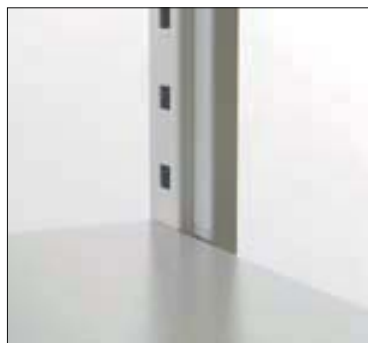
Geschlossener Stahlsteher – Profil